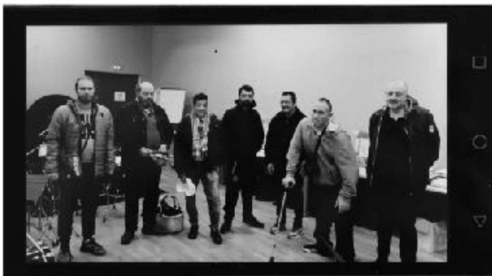
Adultes de l'hôpital de jour psy