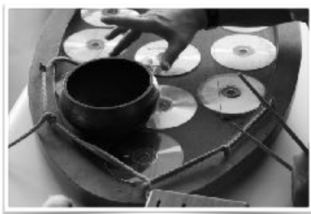
Table à sons

Demande d'un éclairage adaptés pour la salle Mosaïque.